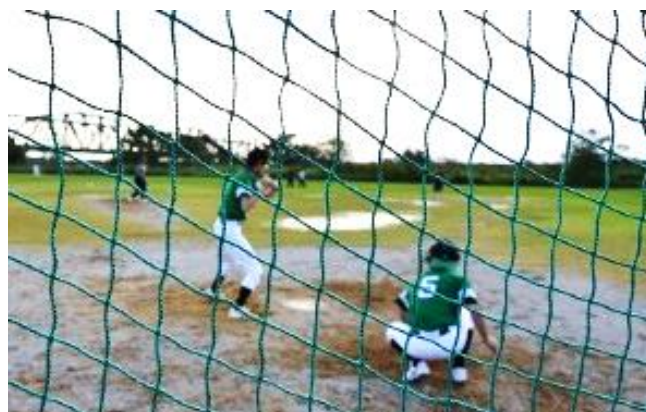
試合の様子(右) 前日の夜からの雨でグラウンドにはところどころ水たまりが・・・

10月27日(土)、長良川沿いにある江崎運動場にて、当社の野球部による、ある試合が行われました。それは「現役 VS OB」のドリームマッチ！すでに野球部から退かれた先輩方や、定年退職された方等にもお声かけし、参加者を募りました。当日はほかの社員も応援に駆け付け、飛び入りでバッターボックスに立つ等、かつてないメンバーでの試合となりました。猛暑を乗り越え、気づいたら早くも肌寒い季節になりましたが、楽しい試合と運動で身体はほかほか暖かくなりました。