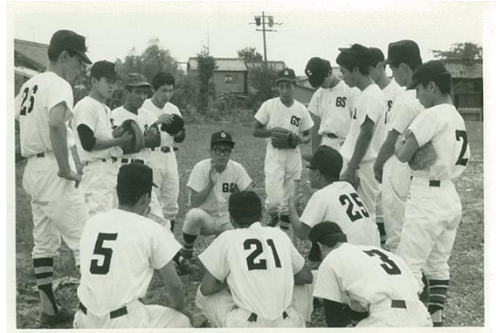
昭和 50 年頃 野球部試合前

当社の野球部は、昭和 36 年頃に発足しました。当時の工場は、現在ほど自動化されているわけではありません。ほとんどの作業がヒトの力で行われていました。ゆうに 70kg を超える荷物を一人がかついで運ぶことも当たり前だったそうです。日ごろの業務で自然と鍛え抜かれた身体を使い、徐々にメンバーを増やし、徐々に力をつけた GSM 野球部は、のちのち県大会に出場できるほどの力を手に入れました。